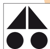
Verbindingsroutes naar andere routes