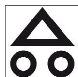
Verbindingsroute binnen Haaksbergenroute